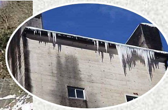
常用洪水吐設備の屋根 (コンジットゲート)