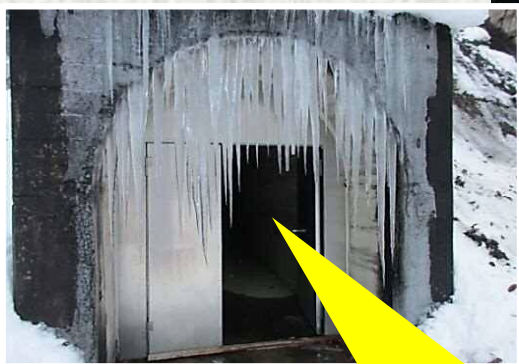
ダムの内部から外へ通じる扉 (正面から撮影)