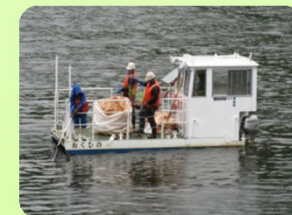
作業船「おくひの」による回収作業のようす