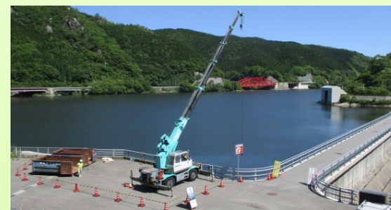
集めた流木などをクレーンで引き上げます

5月に菅沢ダムの湖面清掃を実施しました。これからの大雨により、上流の山などから流れてきた流木や落ち葉などを取り除く作業です。流木や浮遊物が、ダムの湖内に蓄積するとダムの施設を傷つけたり、また水質が悪くなる恐れがあるため、定期的に行う必要があります。 菅沢ダムでは今年も洪水期(日野川では6月20日から10月20日までの期間)に向けて、準備を進めています。 ※下の写真が清掃中の作業風景になります↓