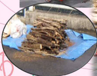
回収した流木やゴミ等