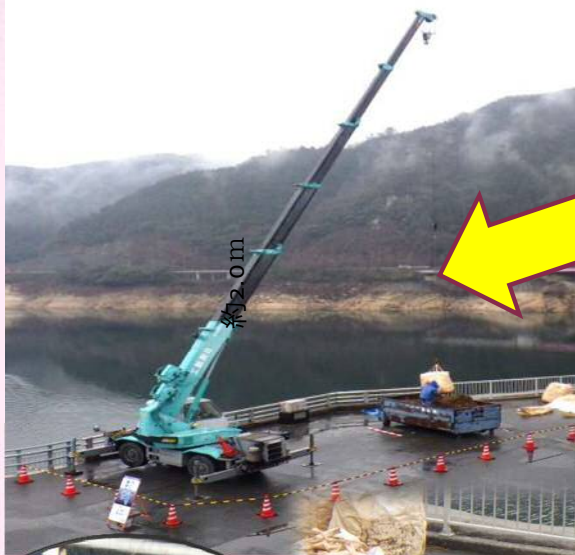
集めた流木等をクレーンで 引き上げます

菅沢ダムでは、1月に湖面清掃を実施しました。（例年、湖面清掃は年に2～3回程度行っています。） 流木や浮遊物は、ダム湖内に留まると ダムの施設を傷つけたり、水質が悪くなる恐れ があるので定期的に除去を行う必要があります。 また、 流木止設備（網場） は上流（印賀川や中原川等）から流れてくる流木やゴミを止める役目をしています。