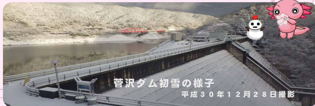
菅沢ダム初雪の様子