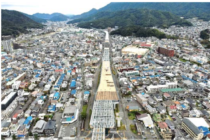
③ 海田高架橋（仮称）から東広島方面を望む