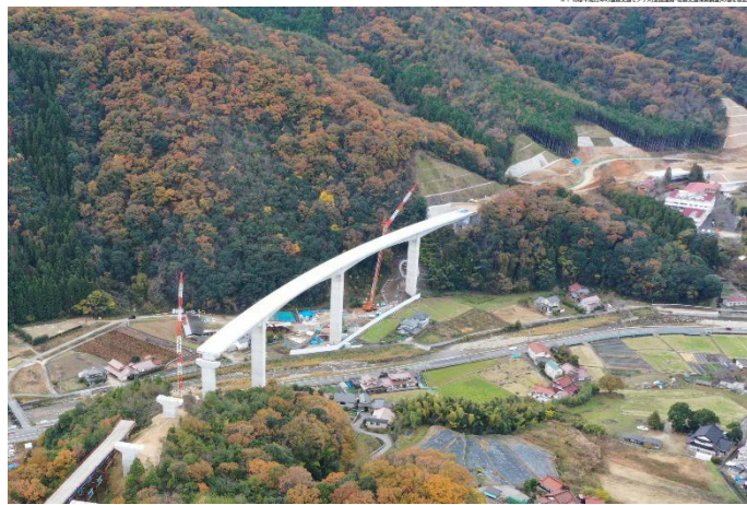
② 熊野川高架橋（仮称）から広島方面を望む