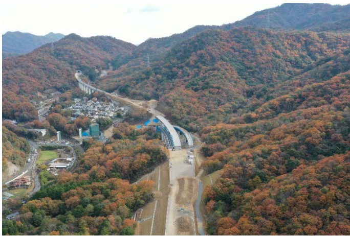
① 上大山地区から東広島方面を望む