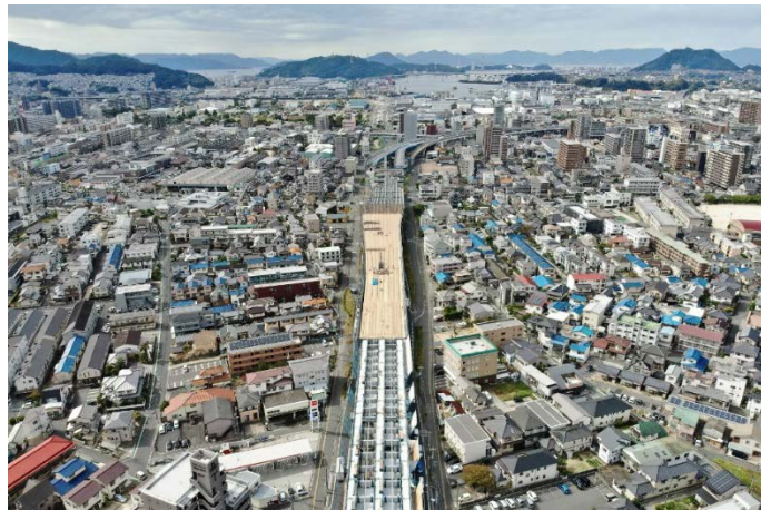
④ 海田高架橋（仮称）から広島方面を望む