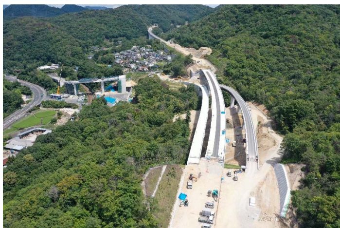
① 上大山地区から東広島方面を望む