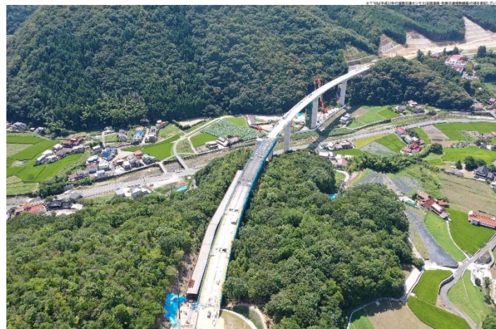
② 熊野川高架橋（仮称）から広島方面を望む