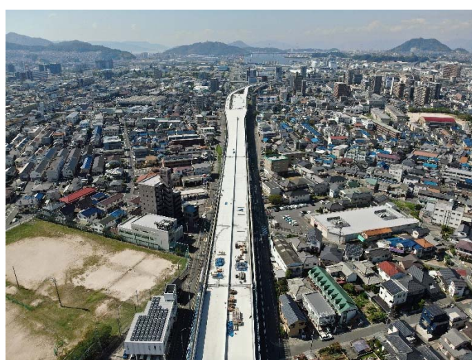
④ 海田高架橋（仮称）から広島方面を望む