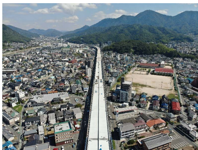
③ 海田高架橋（仮称）から東広島方面を望む