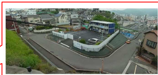
受付場所(旧ふれあい広場)