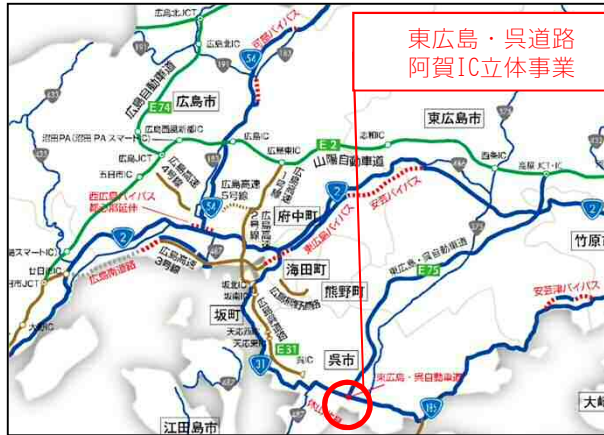
東広島・呉道路 阿賀IC立体事業

現在、東広島・呉道路の阿賀IC出口の渋滞対策として立体交差事業を行っております。立体交差事業のため、令和1年9月25日から一般国道185号の車線数を変更しております。今後、立体交差を行うための橋梁工事を行ってまいります。大変ご迷惑をおかけいたしますが、ご理解ご協力をお願いいたします。