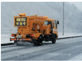
凍結防止剤の散布作業状況