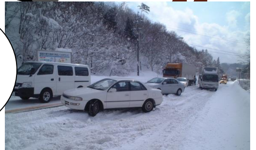
冬用タイヤ未装着車による交通遮断