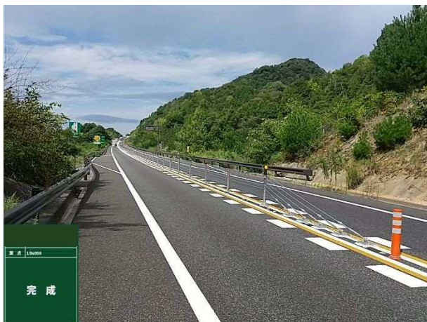
【設置状況】 【E75】東広島・呉自動車道（阿賀 IC～馬木 IC 間）