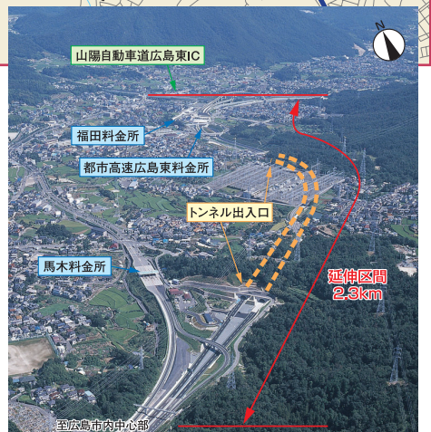
広島市東区馬木上空から都市高速広島東料金所付近を望む