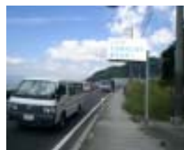
国道31号小屋浦方面