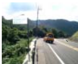
国道2号上瀬野方面