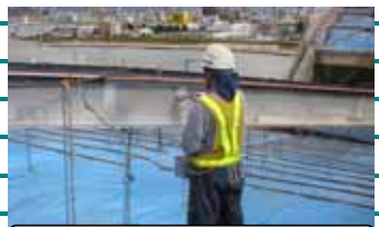
国道2号旭橋塗替工事