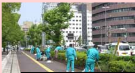
中国電力(株)広島営業所のみなさん いつもありがとうございます。

ボランティア・ロードは、地域住民、地元自治体及び道路管理者が協力して、道路の美化清掃活動を行い、地域住民共有の生活空間である道路への愛着心を深めるとともに、道路利用者のマナー向上を啓発することを目的としています。 皆さんも参加しませんか？