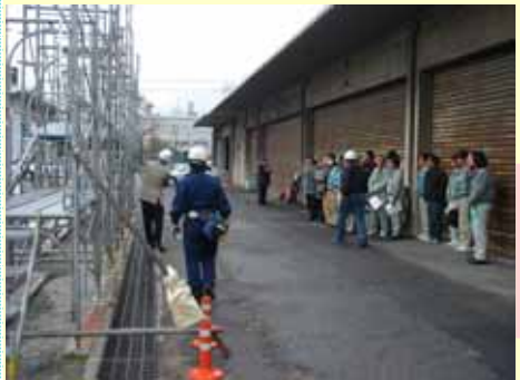
広島維持出張所構内で組立足場の説明を受ける会員17名

労働災害の特に多くを占めている、墜落・転落災害を撲滅するため、昨年12月7日、広島維持出張所建設工事安全対策協議会の主催によって、中国地方整備局管内で初めて「仮設安全監理者特別教育講習会」が行われました。