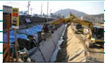
国道2号中野東外防災工事