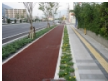
自歩道部分の状況