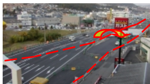
平成15年11月末の状況