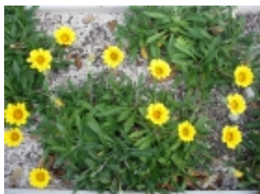
ガザニアクイーンの近景

※6車線化で供用している所のどこかにこんな看板があるよ。現地で探して、詳しい植樹の情報をゲットしよう。