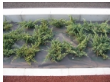
ハイバクシンの近景