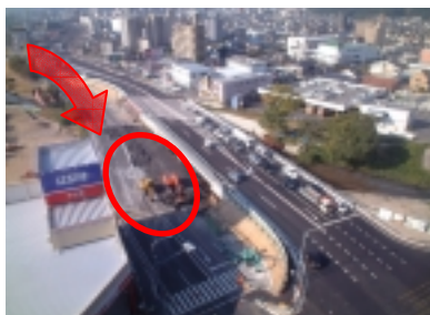
平成15年11月初旬の状況