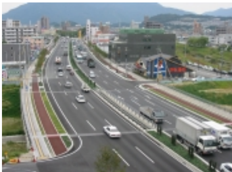
6車線供用部分の状況

平成15年5月末に毘沙門台東入口交差点からせせらぎ西口公園交差点までの0.6km区間を6車線で部分供用しています。また、自歩道部分にはガザニアクイーン、ハイバクシン類を植えて景観にも配慮しています。