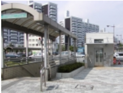
エレベータ完成状況