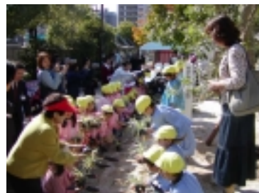
祇園幼稚園の園児達による植付け風景 (苗：フィリヤプラン)

平成15年10月29日に『秋の都市緑化月間』の行事として、祇園新橋北駅前広場で地元関係者によるヤマモモの記念植樹、原保育園と祇園幼稚園の園児達による花の苗の植付けが行われました。