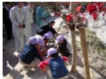
原保育園の園児達による植付け風景 (苗：ガゼニアクイーン)