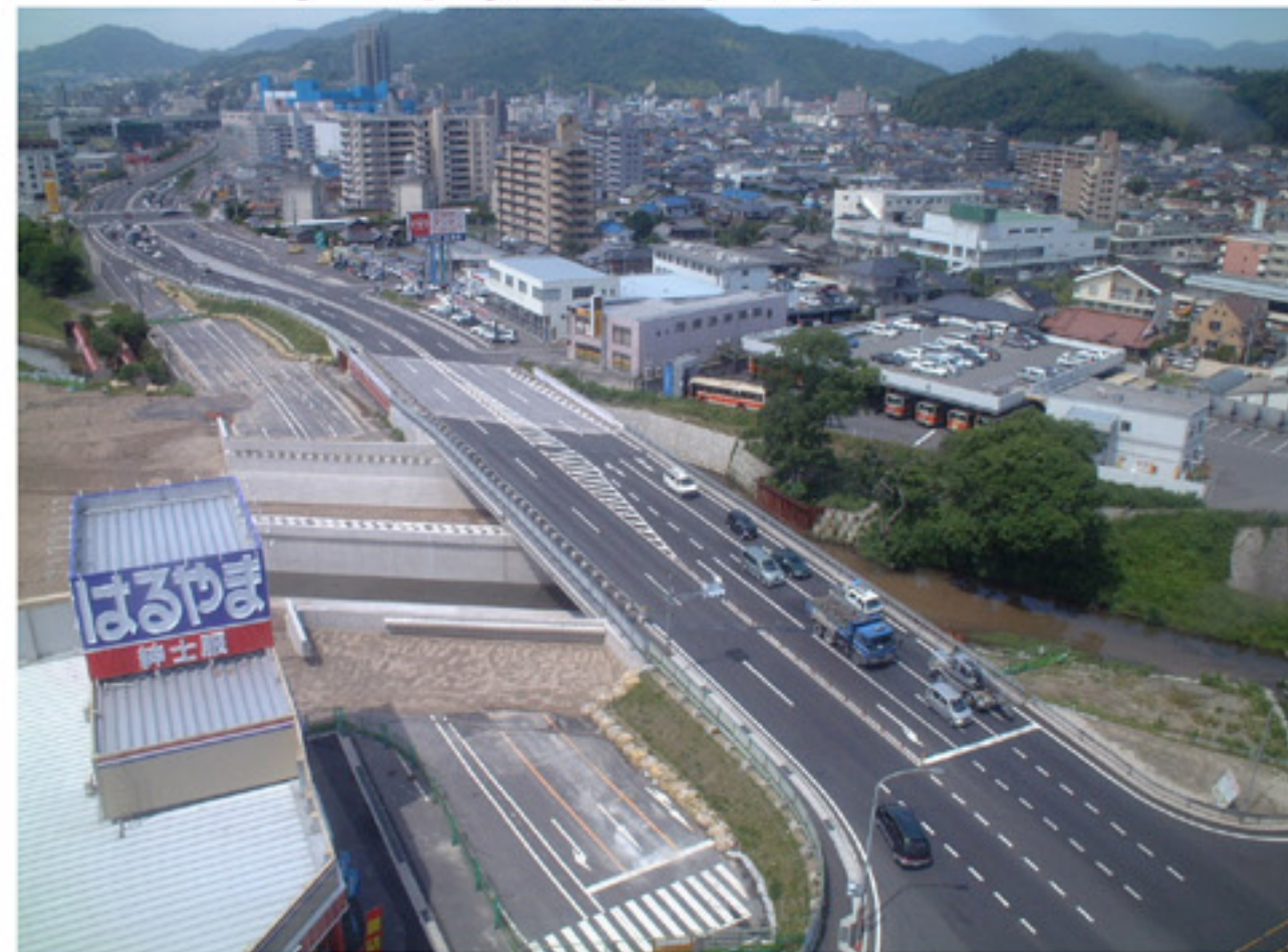
下部工完成直後のようす