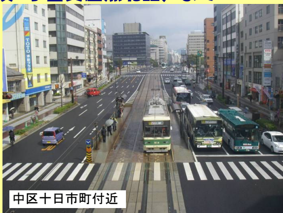
中区十日市町付近