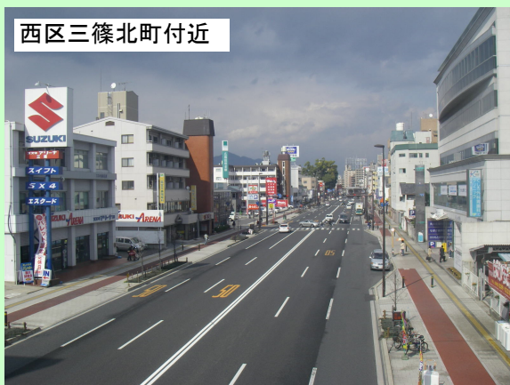
西区三篠北町付近

安佐南区内の国道183号 →広島市安佐南区役所農林建設部管理課 (電話082-831-4948、Fax082-877-7749)