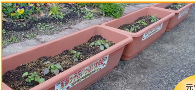
～何色のパンジーが咲くか楽しみです～