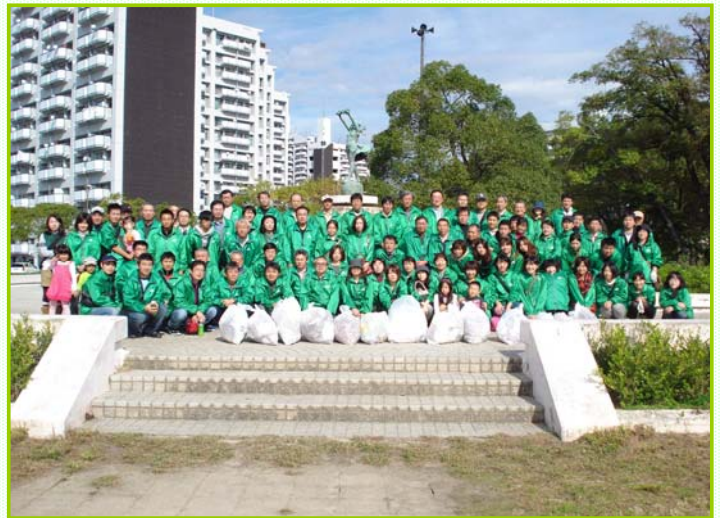
～活動後の集合写真～

清掃活動を通して、町をきれいにするだけでなく、地域の方々との交流を図ることができ、職員の環境美化に対する意識も向上しました。