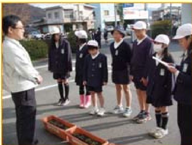
～手紙と一緒にプランターを受け取りました～

2月1日(水)、広島市立可部南小学校5年生の児童が自分たちで育てたパンジーのプランターを可部国道出張所に届けてくれました。 可部南小学校などでは、「心の元気を育てる地域支援事業」の一環として花の苗を育て、学区内にある施設等に花を飾る活動をしています。