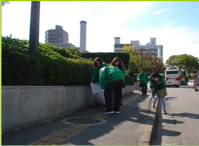
～1班10人程度で12班に別れ、2時間程度道路のゴミ拾いを行いました～

「JA共済連広島」の皆様は、平成23年11月にボランティア・ロードに加入されました。活動範囲は国道54号中区大手町4丁目JA前～基町までの歩道で、上下線あわせて約5.2kmもの広範囲を清掃活動することになりました。その初めての清掃活動について紹介します。