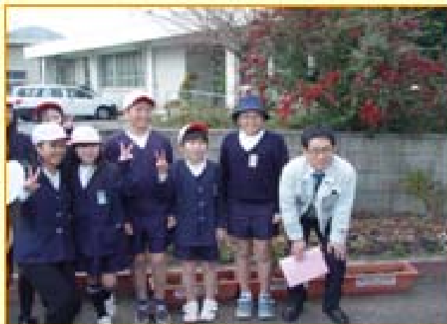
～プランターの前で記念写真～