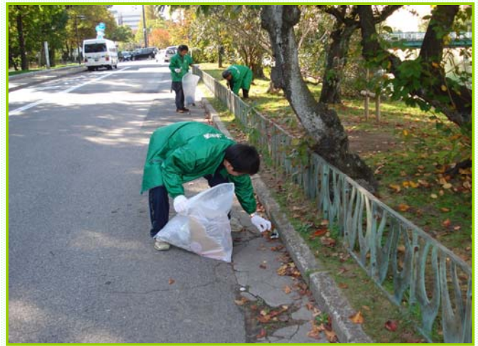
～天気も良く、気持ちよく清掃できました～