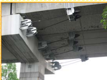
落橋防止装置の例①