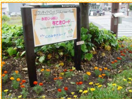
～かわいい花壇ができました～

「にのみやグループ」の皆様は、平成20年6月にボランティア・ロードに加入され、安佐北警察署北交差点の歩道の清掃や花壇の水やりなどの活動を毎朝行っています。