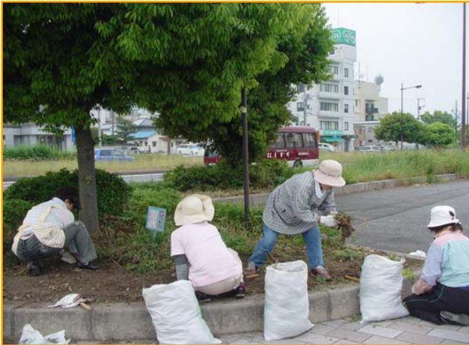
～植樹帯を除草し、スッキリしました～

5月20日(日)に「にのみやグループ」の皆様が、国道54号可部バイパスの歩道で、清掃・除草活動と花壇の花の植え替えを行いました。