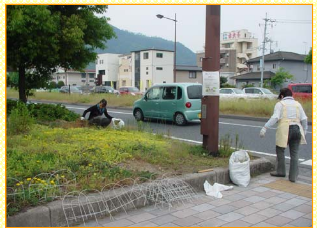
～車からの視界も良好になりました～