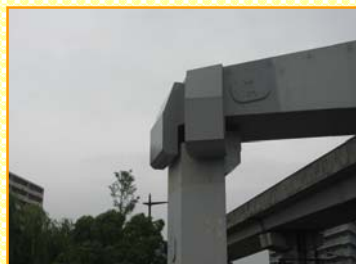
落橋防止装置の例②