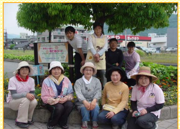
～最後に記念写真 お疲れさまでした～