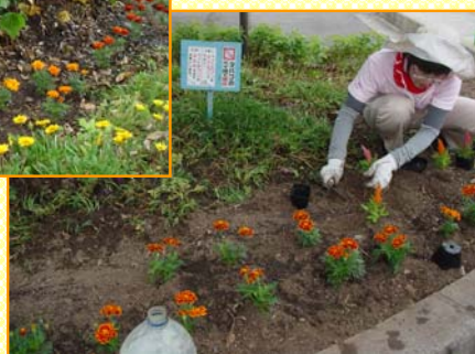
～マリーゴールドを植えました～