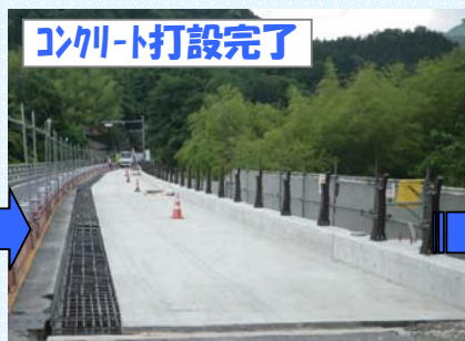
コンクリート打設完了