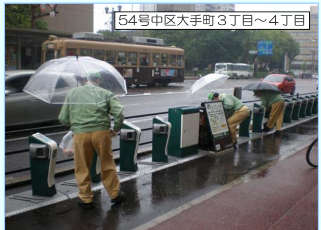
54号中区大手町3丁目～4丁目