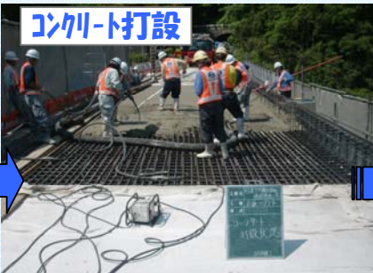
コンクリート打設