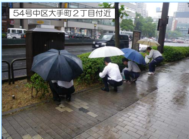
54号中区大手町2丁目付近