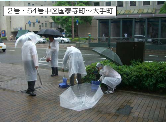
2号・54号中区国泰寺町～大手町