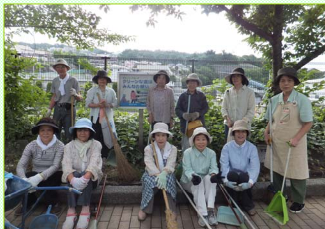
～最後に記念写真☆おつかれさまでした～