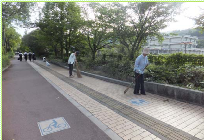
～午前6時半から約1時間清掃を行いました～

平成24年7月8日(日)に「牛田新町女性会」の皆様が、国道54号東区牛田新町の歩道で清掃活動を行いました。いつも牛田駅付近と不動院駅付近に分かれて清掃されており、今回は牛田駅付近の活動の様子をお知らせします。