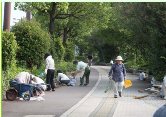
～歩道がきれいになり、気持ちよく通れるようになりました～