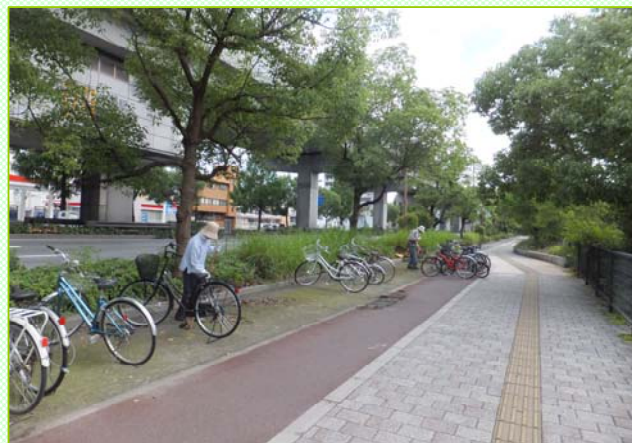
～自転車を1台1台移動して落ち葉を掃きます～