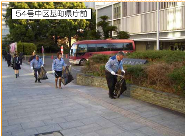
54号中区基町県庁前

平成24年11月9日に加入したばかりでしたが、一斉清掃活動に参加してくださいました。