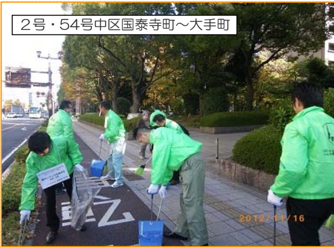
広島電業協会の皆さん