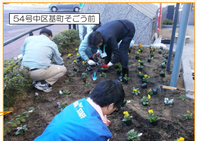
54号中区基町そごう前