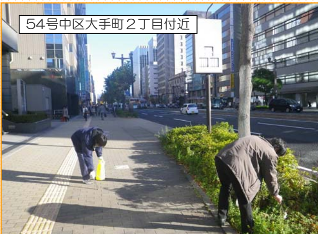
パーカー広島の皆さん