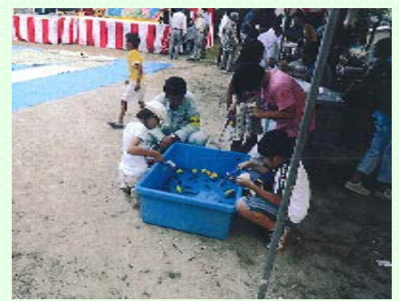
～地域の子供たちとの交流～

祭り会場では工事内容や環境への取り組みの説明を行い、地域との交流が深められました。