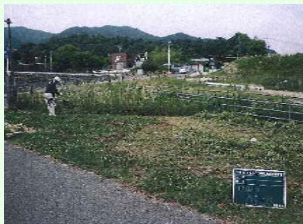
～イベント会場の草刈り～