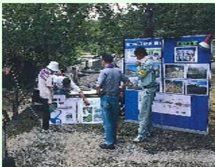
～工事説明と汚泥リサイクル製品の無料配布～