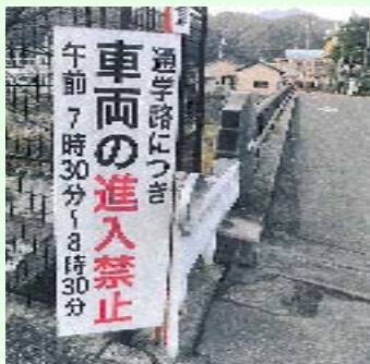
～小学校前の進入禁止看板作成～