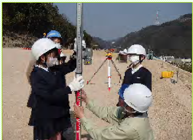
～測量機器を使い、高さや距離を測る体験をしました～