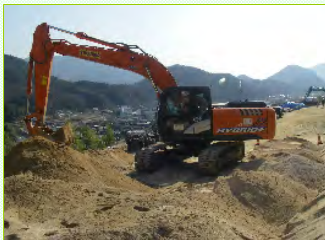
～施工業者とパワーショベルに乗り込み、土砂を積み上げました～