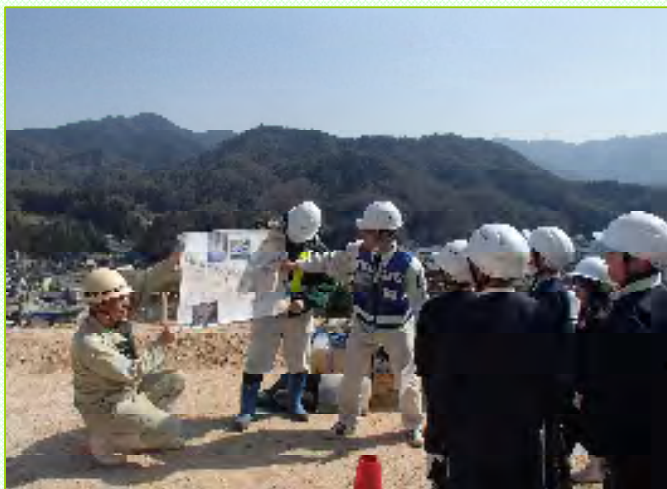
～可部バイパスの役割について説明を受けました～