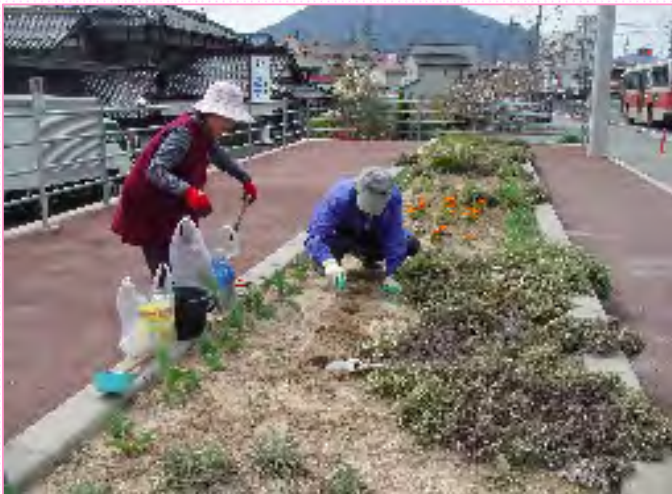
～広い花壇にいろいろな花が植えられています～

平成25年3月26日(火)に「南原口花街道」の皆様が、国道54号安佐北区三入一丁目の花壇で花植えを行いました。