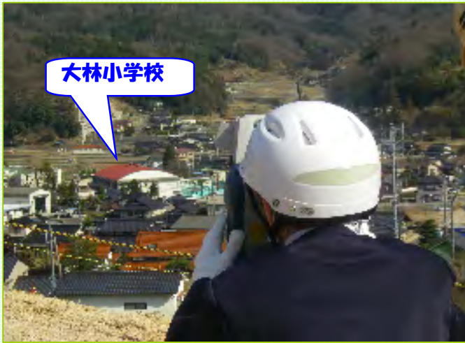
～測量機器で大林小学校を見てみました～