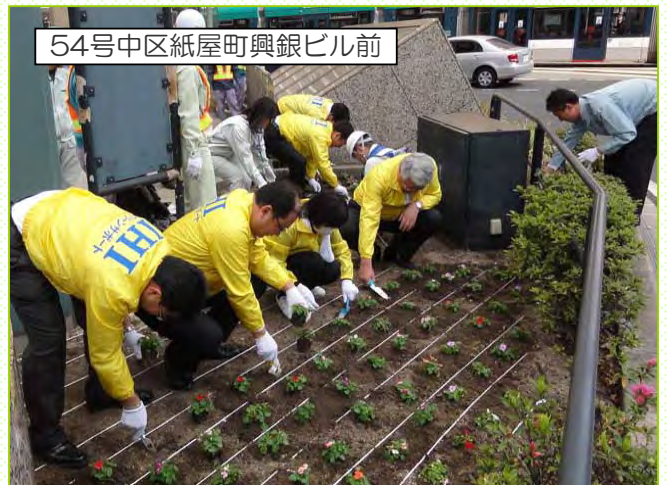
54号中区紙屋町興銀ビル前