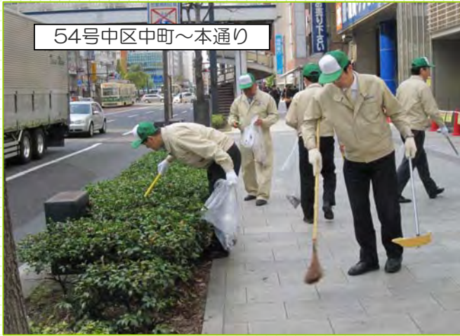
54号中区中町～本通り