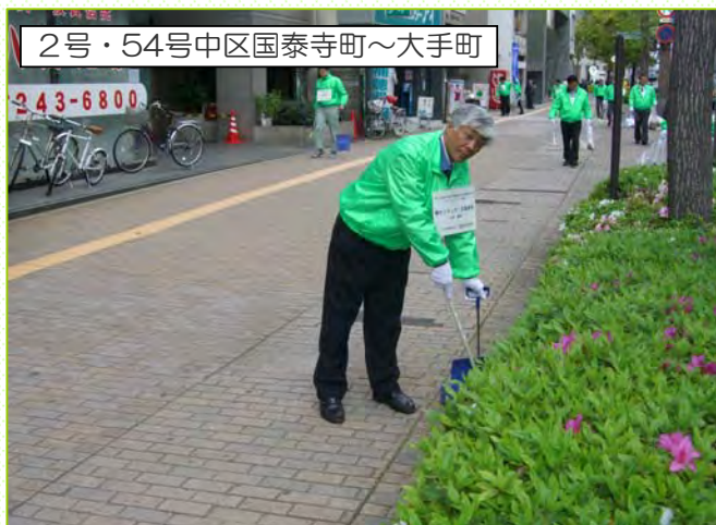
2号・54号中区国泰寺町～大手町