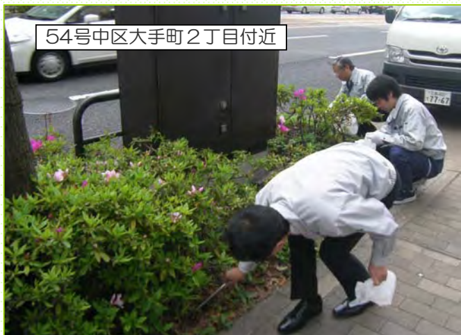
54号中区大手町2丁目付近