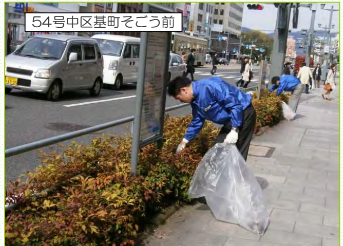
54号中区基町そごう前