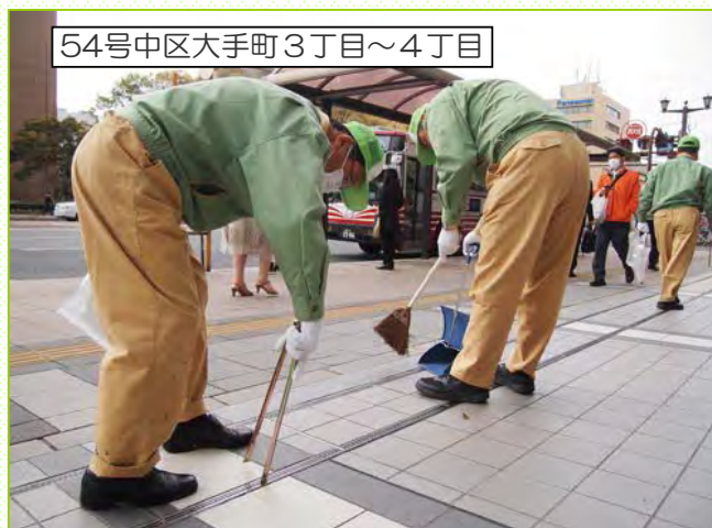
54号中区大手町3丁目～4丁目