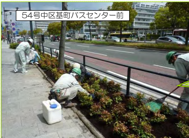
54号中区基町バスセンター前