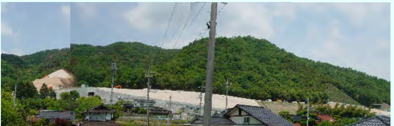
大林町から見える工事風景