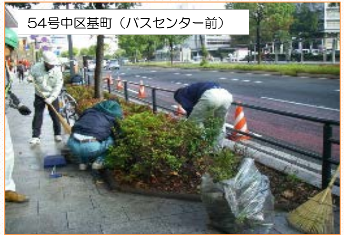
日造緑化ボランティアチームの皆さん