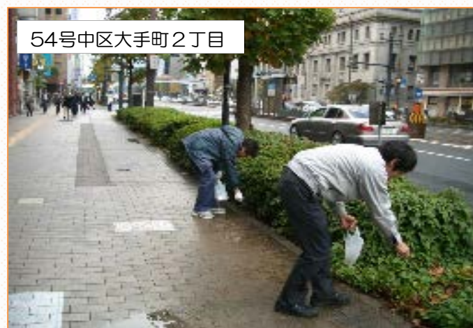
54号中区大手町2丁目