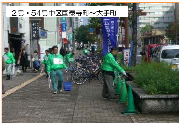
2号・54号中区国泰寺町～大手町