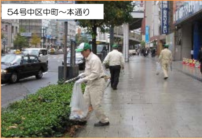
クリーン鹿島ボランティアロードの皆さん