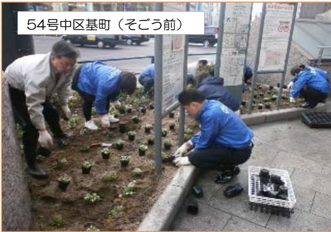
(株)そごう・西武 そごう広島店の皆さん