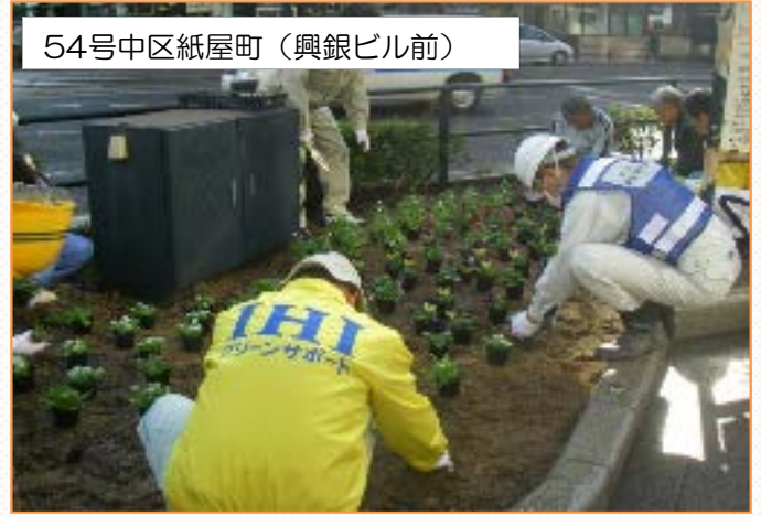
IHIグリーンサポートの皆さん