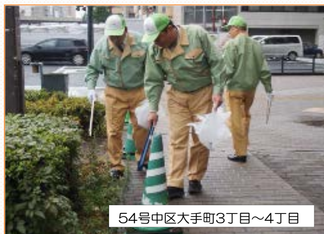
54号中区大手町3丁目～4丁目