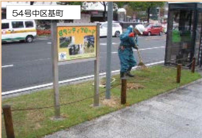
広田造園ボランティアクラブの皆さん

そごう前と興銀ビル前の花壇にパンジー、アリッサム、スノーポールを植えました。今は小さな花ですが、だんだん大きく広がっていきますので、お楽しみに。