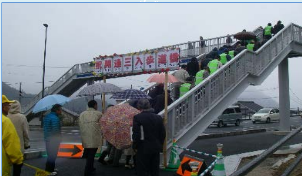
～地元の方々による渡り初め～