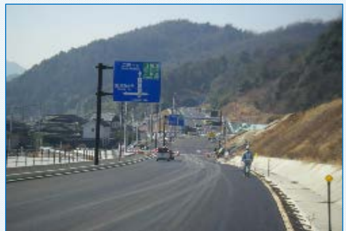
標識や防護柵なども設置されています