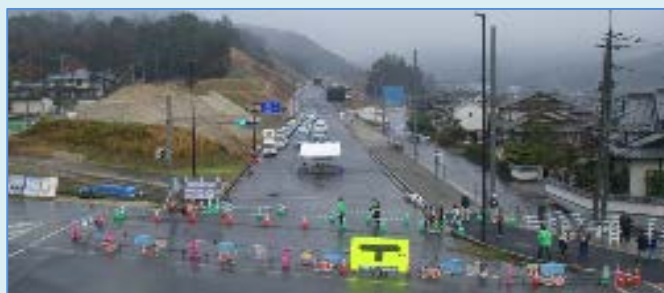
～歩道橋から見た工事中のバイパス～