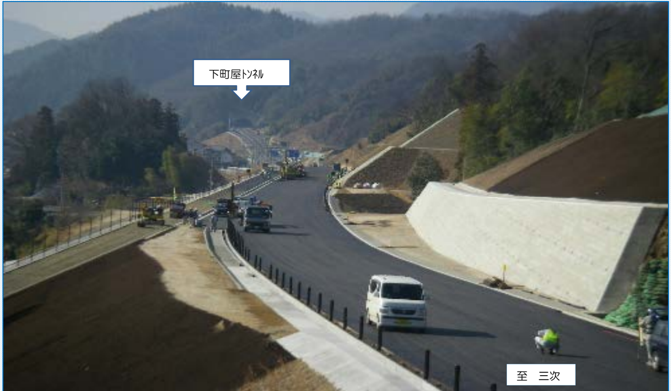
大林トンネル南側から広島方面の下町屋トンネルを臨む