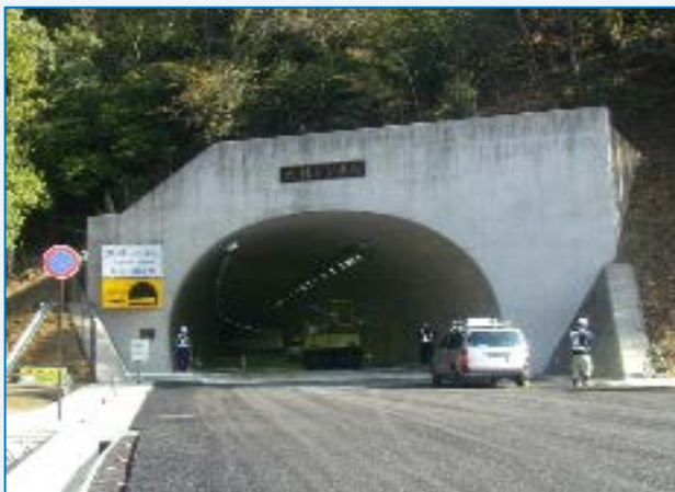
大林トンネルにLED照明がつけました