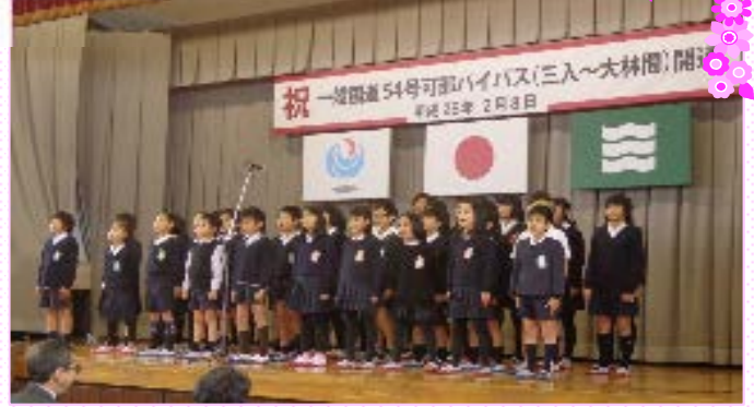
三入小学校児童による合唱『ひかりの空へ』