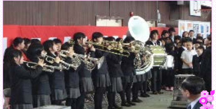
安佐北高校吹奏楽部による演奏