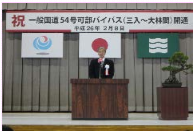
~栗田局長のあいさつ~