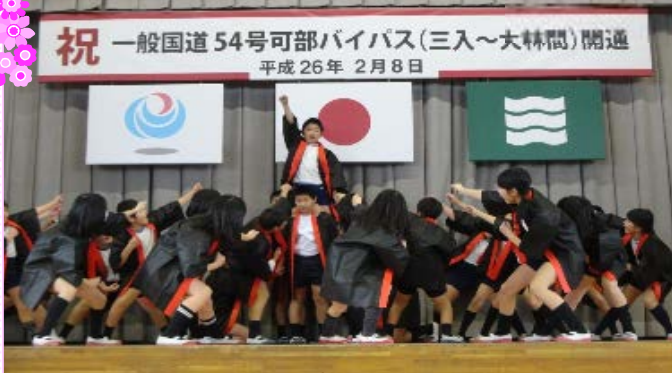
大林小学校児童による大林ソーラン