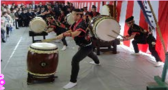
広島文教女子大学附属高校「文教太鼓 葵（あおい）」による和太鼓演奏