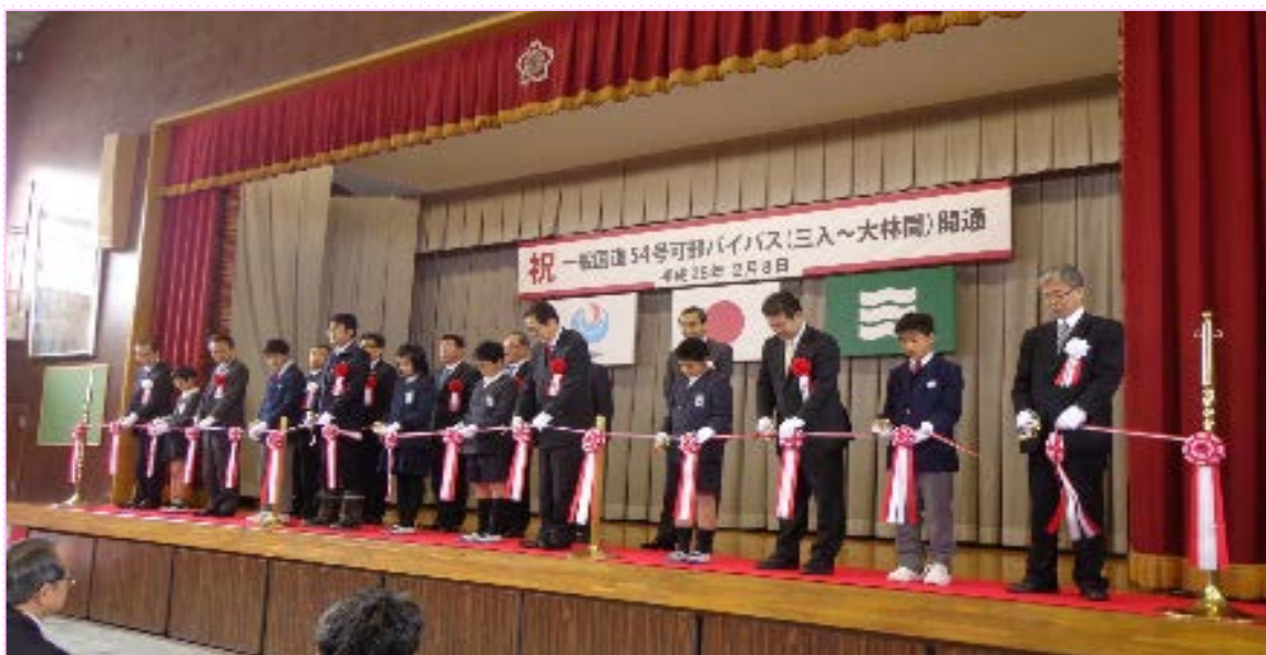
~テープカットの様子~