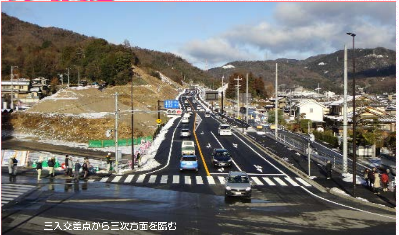
三入交差点から三次方面を臨む