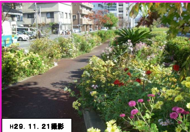
H29. 11. 21撮影

ボランティア・ロード活動による植栽をはじめ、可部国道出張所管内には、いくつ か四季を通じて花の見所があります。すでに厳しい寒さで枯れてしまったものも多 いですが、あえて遡って秋の花を中心に見所を紹介いたします。