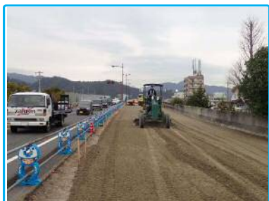
アスファルト舗装の路盤材(碎石)を敷均しています。