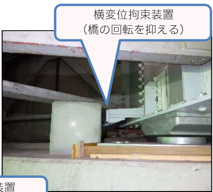
横変位拘束装置 (橋の回転を抑える)