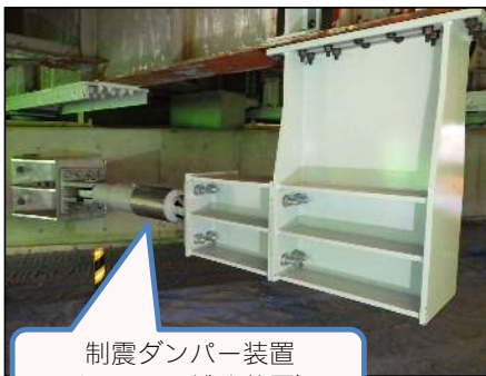
制震ダンパー装置 (橋脚部の補強装置)