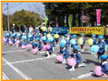
横路保育園の子どもたちが、チアダンスでイベントを盛り上げてくれました。