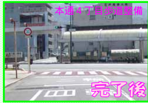
本通4丁目歩道整備