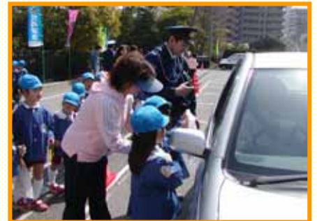
安全運転をお願いします。