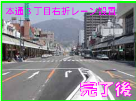
本通3丁目右折レーン設置