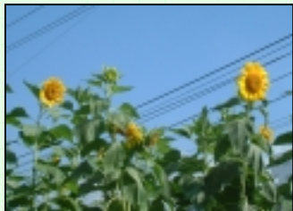
この夏も大きなひまわりが咲きました