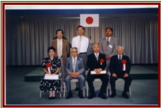
左下段から はなみずき会 広末広老人クラブ 天応小学校 広末広老人クラブ 左上段から 本通商店街振興組合 本通商店街振興組合 呉国道出張所

「本通はなみずき会」は地元商店街の女性部の方たちが本通1丁目から4丁目にかけて1995年のアーケード完成をきっかけに結成され毎月1回の歩道の清掃や草木の管理を実施していました。昨年12月にはボランティアロードとして国土交通省と協定を結び、花壇の維持管理を通し、商店街の美化・活性化を目的に活動しています。(今月号裏下面に、今月の活動状況記載しています)