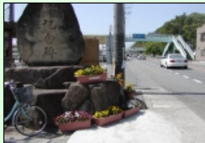
大屋橋バス停のフラワーポット

また、学校周辺の市道や駅、公園等公共施設などにもフラワーポットを設置し、管理・清掃等を行い道路利用者の模範となっています。過去には、昭和51年中国地方建設局長表彰、昭和53年には道路協会会長表彰を受賞されました。