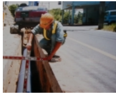
平成12年度 川尻情報ボックス工事の様子