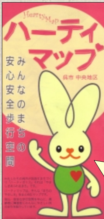
呉市中央地区のハーティマップ

ハーティマップとは ……呉市中央地区の地図に、公共交通機関や駐車場、公共施設、主要なお店の情報と共に、バリアフリー化が進んでいる代表的な施設のバリアフリー設備の整備状況も掲載された内容になっており、健康な方はもちろん、障害者の方やお年寄り、妊婦さんや子供連れさんなどが施設を利用するのに便利な内容となっています。