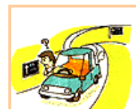
距離の表示がおかしい。