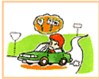
路線番号や現在地の表示がないため、どこを走っているのか分からない。