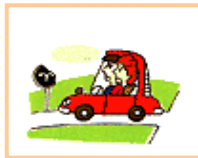
標識が壊れていて見にくい。