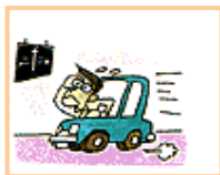
文字が小さくて読みづらい。