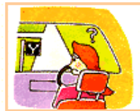
方向の表示が実際の道路形状にあっていない。