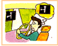
目標地の表示がおかしい。