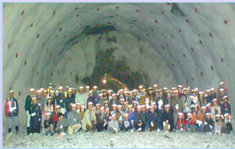
貫通点での記念写真