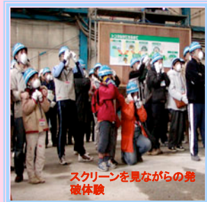
スクリーンを見ながらの発破体験