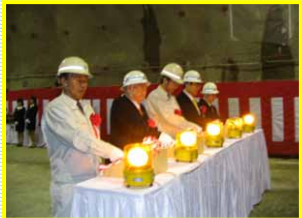
呉市長、広島国道事務所長、地元地権者、工事関係者が最終発破ボタンを押して点火すると、ドン！ドン！と発破の音が鳴り響き、その後、貫通したことが告げられました。