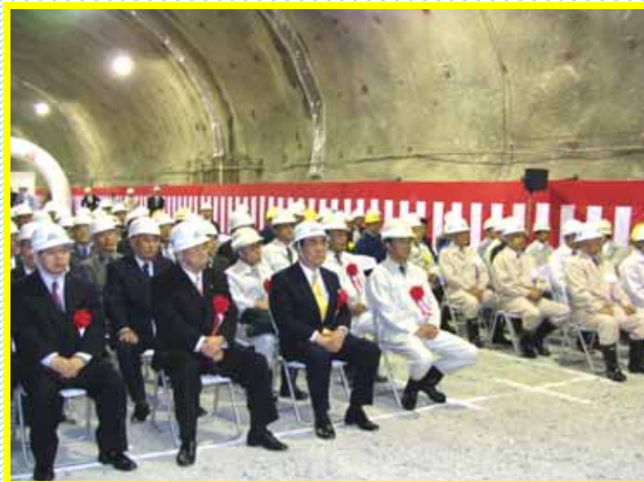
貫通式には市長をはじめ、地元地権者、工事関係者等約200名が出席し、貫通を祝いました。