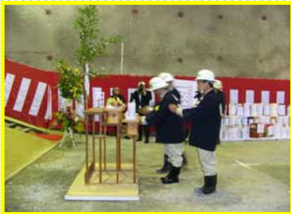
工事関係者によって、貫通点の清めの儀が行われました。酒や、米によって貫通点を清めた後、出席者全員で、拝礼しました。