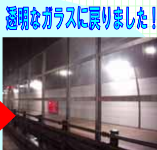
透明なガラスに戻りました!