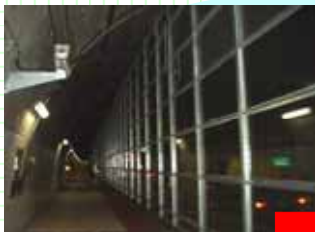
真っ黒のガラスが...