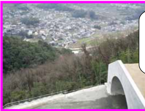
東広島側坑口より広石内を望む