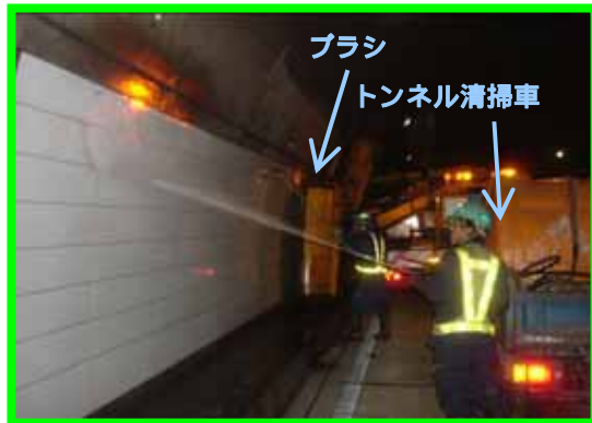
トンネル清掃車の大きなブラシで いっきに清掃します。