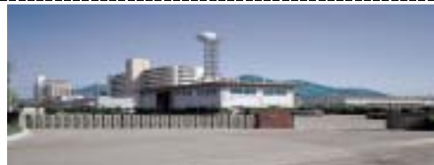
〔呉国道出張所の仕事〕

〒737-0125 呉市広本町1丁目5-33 TEL 0823(73)4798 FAX 0823(73)9414