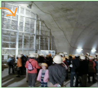
この奥の横穴を通り縦穴の真下へ行きました。

トンネル内のほぼ中央にある縦坑（トンネル内の排気を出すための縦穴）は、開通後は中に入る事が出来ない事もあり、今回は参加者に縦穴の真下まで歩いてもらいました。 冷たく薄暗い縦坑をみなさんは冒険気分でいどんだのではないのでしょうか？