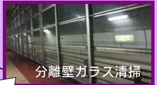
分離壁ガラス清掃

実施場所: (呉市本通り6丁目～呉市阿賀中央6丁目) 国道185号(1K300m～3K540m) 実施日 : 平成19年7月30日・31日・8月1日・3日