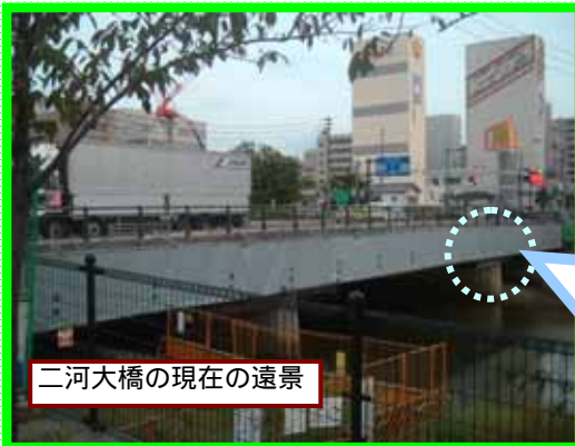
二河大橋の現在の遠景