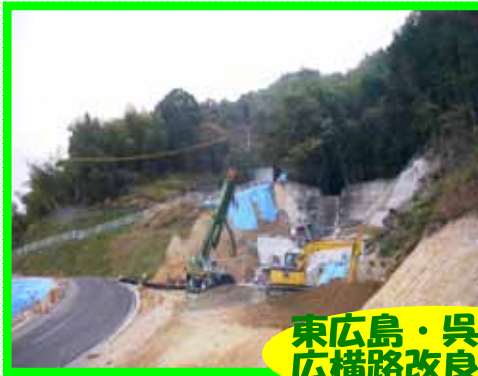
東広島・呉道路 広横路改良工事