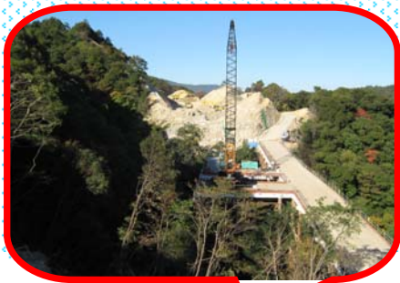
二級峽第四橋 二級峽第三橋