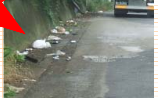
路上に散乱した投げ捨てられたゴミ(国道2号)