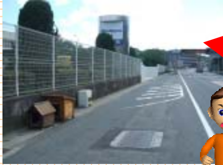
路上に放置された犬小屋と電気製品(国道2号)