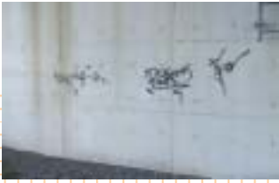
壁面に描かれたらくがき(国道2号)