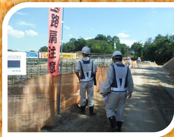
～ 現場安全パトロール ～