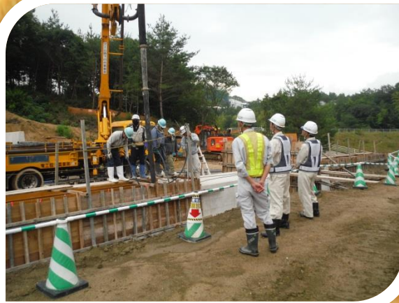
～ 簡易パーキング整備工事 ～