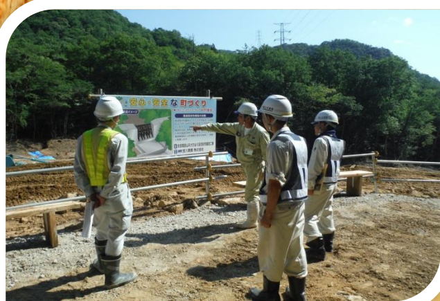
～ 直轄砂防災害関連緊急時事業 ～