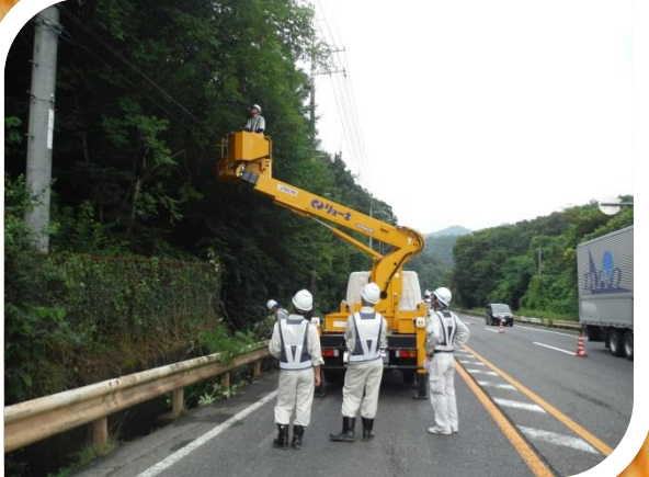
～ 国道2号保守工事（伐採） ～