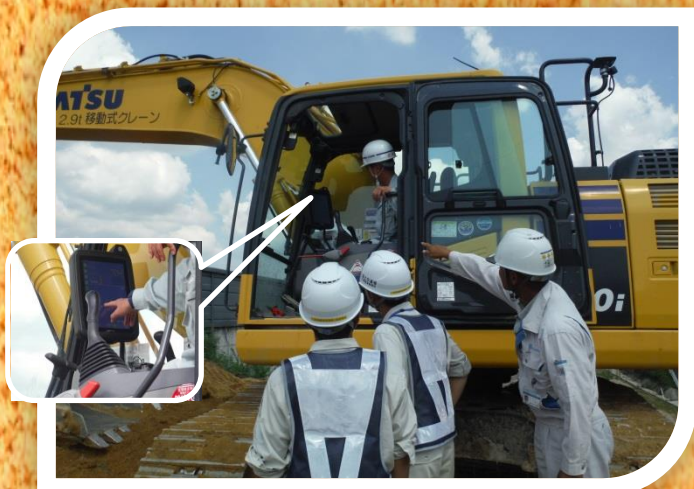
～ 安芸バイパス（ICT施工）工事 ～