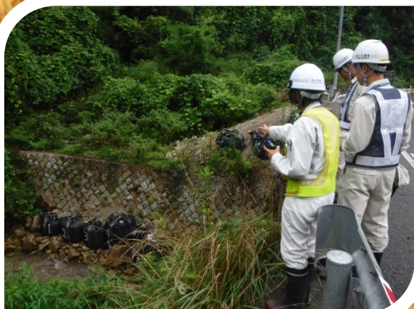
～ 国道2号パトロール ～

この度の体験が、国土交通省という職場の役割について理解を深めてもらうとともに、将来の進路選択や普段の学習意欲の向上につながってくれることを願います。