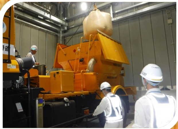
～ 郷原除雪基地（除雪車） ～