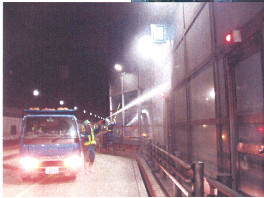
▲ 休山トンネル入口(上り線)