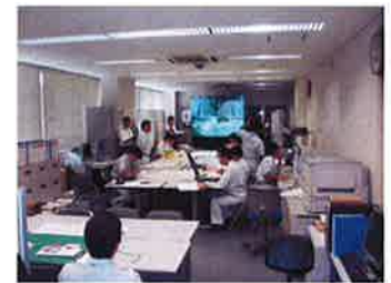
去年の訓練の様子